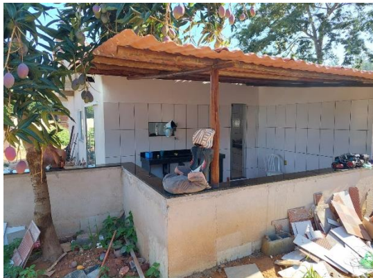
Figura 1 - Vista dos fundos da estrutura antes da intervenção da Renova

Segue abaixo algumas fotos do acompanhamento da obra: