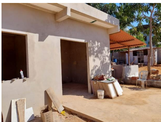
Figura 3 - Vista lateral da estrutura antes da intervenção da Renova