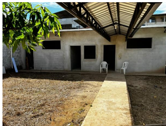
Figura 6 – Evolução da obra. Vista da construção dos vestiários 27/03/24