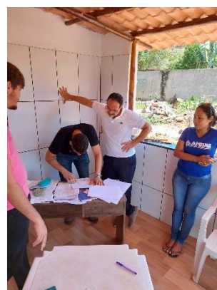
Figura 4 – Alinhamento entre técnicos do IABS e o engenheiro responsável pela obra 26/09/23