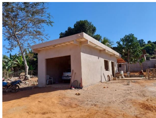
Figura 2 - Vista da frente da estrutura antes da intervenção da Renova