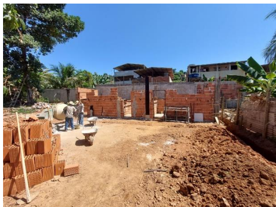
Figura 5 – Evolução da obra. Vista da construção dos vestiários 26/09/23