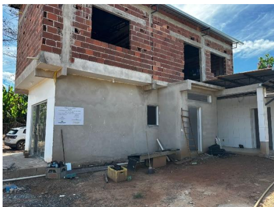
Figura 7 – Evolução da obra. Vista da lateral da estrutura 27/03/24